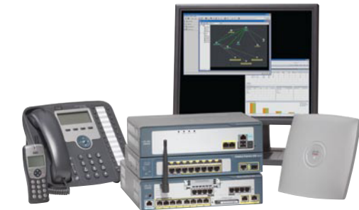
Sistema de Comunicaciones Inteligentes de Cisco