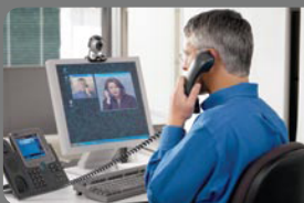
Voz y video