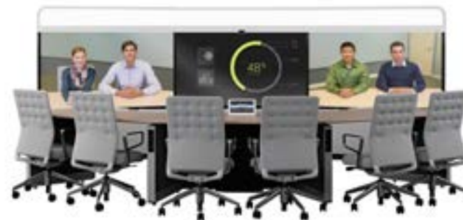
Система Cisco TelePresence® IX5000 позволяет проводить очные встречи сотрудникам глобальных компаний, находящимся в разных странах мира.

Как выбрать оптимальную технологию? Можно ли гарантировать, что создаваемая вами рабочая среда обеспечит оптимальные рабочие условия для текущих и будущих поколений сотрудников? Смогут ли они проявить в ней свой потенциал?