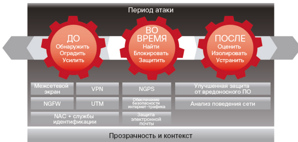
Рисунок 4. Охват всего периода атаки

Эти специальные решения, основанные на платформе, предлагают широчайший набор возможностей для борьбы на всех направлениях атаки. Решения работают сообща, чтобы защитить вашу сеть в течение всей атаки. Их можно интегрировать с другими программами для построения полноценной системы информационной безопасности.