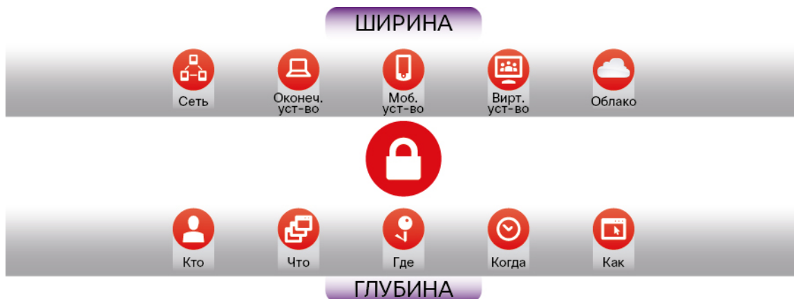
Рисунок 3. Ширина и глубина

Ориентация на угрозу: современные сети работают везде, где находятся сотрудники и данные. Несмотря на значительные усилия, специалисты по информационной безопасности не всегда успевают за злоумышленниками, которые атакуют с новых направлений. Для сокращения радиуса атаки необходимы специальные политики и средства контроля, однако угрозы все равно проникают в сеть. Поэтому технологии защиты должны быть нацелены на обнаружение, анализ и устранение угроз. Ориентация на угрозы означает думать как злоумышленник, опираться на прозрачность сети и контекст для адаптации к изменениям среды и находить способ защиты от угрозы. Новое вредоносное ПО и атаки нулевого дня требуют постоянного улучшения защиты. С этой целью необходим непрерывный сбор данных облачной аналитики, которые передаются во все системы безопасности для повышения их эффективности.