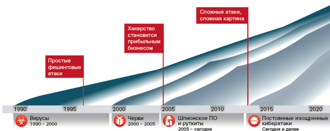
Рисунок 1. Превращение хакерства в бизнес

Благодаря коммерциализации хакерства появляется более быстрая и действенная преступность, которая получает прибыль от нападения на ИТ-инфраструктуру. Организованный обмен вредоносными кодами процветает и приносит доход, а открытый рынок стимулирует переход от простой эксплуатации уязвимостей к краже информации и намеренному повреждению систем. Когда киберпреступники поняли, что они могут хорошо заработать на своем ремесле, их работа стала более упорядоченной и нацеленной на результат. Злоумышленники осознают статическую природу классических методов защиты и их изолированность, поэтому они могут использовать пробелы между зонами защиты и уязвимости в них. Нередко команды хакеров даже следят за разработкой ПО, тестируя качество или испытывая свои продукты с реальными технологиями безопасности. Такая проверка позволяет убедиться, что их вредоносное ПО сможет обойти используемые способы защиты.