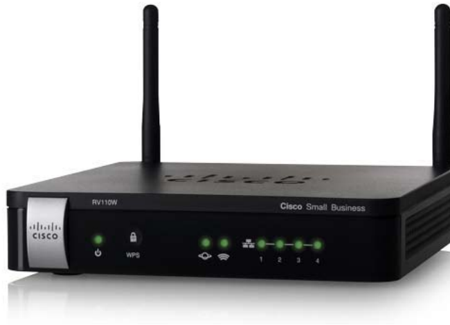
Figura 1. Cisco RV110W – Wireless –N Firewall VPN

Cisco RV110W – Wireless –N Firewall VPN ofrece conectividad a Internet de clase empresarial sumamente segura, simple y asequible para pequeñas oficinas y el hogar, y para trabajadores remotos.