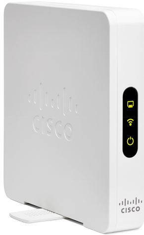
Abbildung 2. Rückseite des Cisco WAP131 Wireless-N Dual Radio Access Point mit PoE